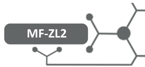
Diagrama de Ligações