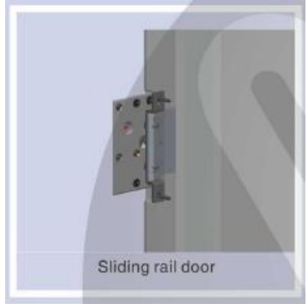
Sliding rail door